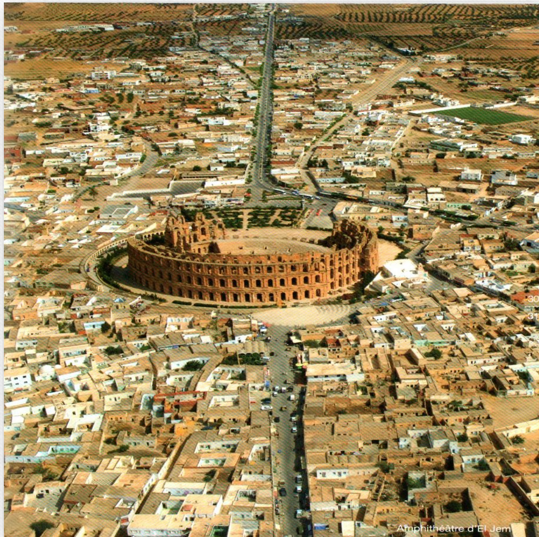
Amphithéâtre d'El Jem

Vue générale de l'amphithéâtre romain dans la ville archéologique d'El Jem ( d'après ONTT Discover tunisia 2016).).